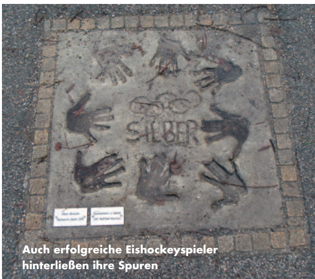
Auch erfolgreiche Eishockeyspieler hinterließen ihre Spuren

Auf der Platte daneben haben sich zwei Goldmedaillengewinner von 1972 verewigt: Klaus Wolfermann (Speerwerfer) und Hans Johann Färber (Ruderer im Vierer mit Steuermann)