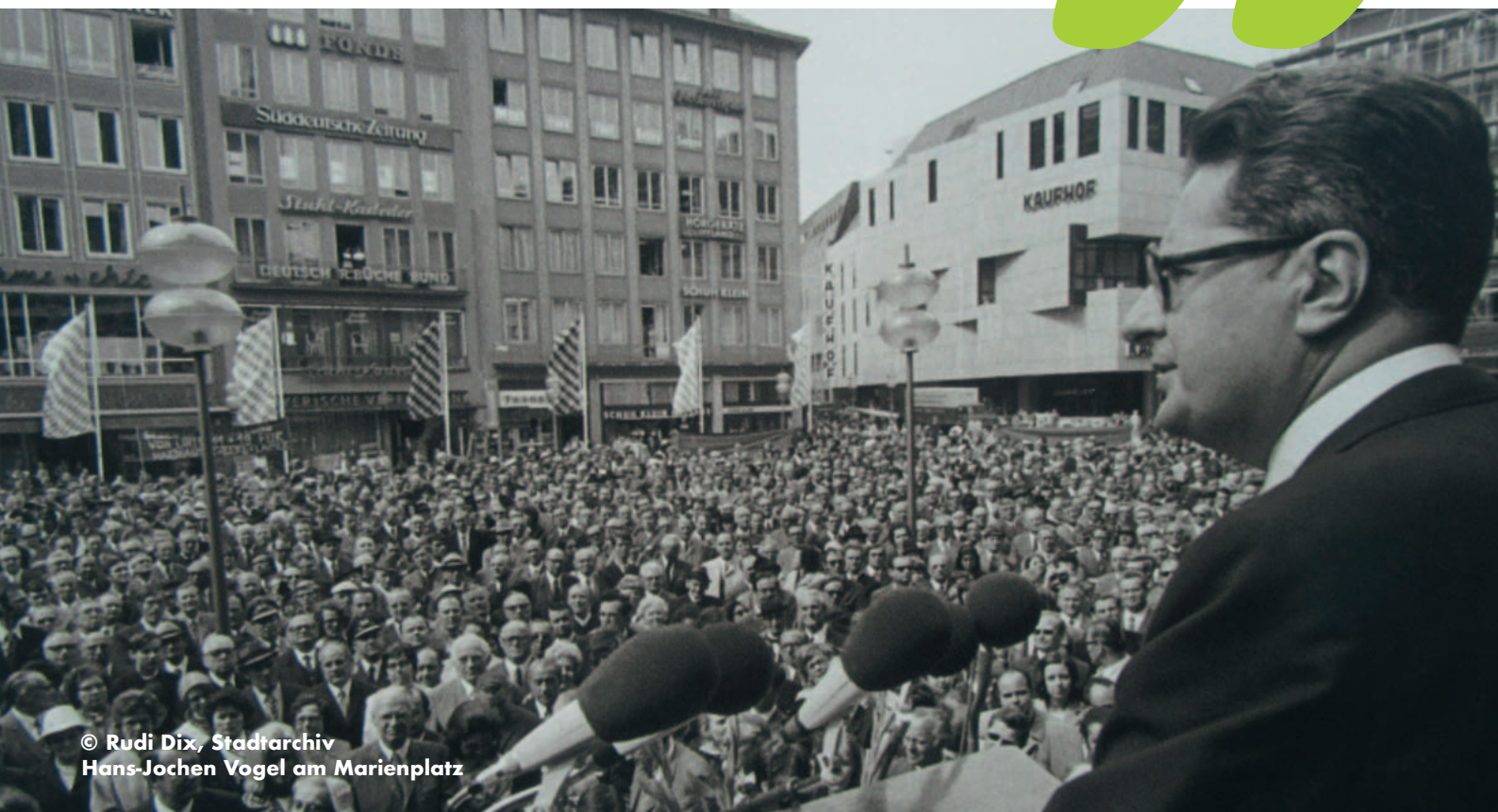
Hans-Jochen Vogel am Marienplatz

Ein breites Schild erzählt mehr von seinem Leben. Andere Ereignisse fielen ebenfalls in seine Amtszeit. Suchen Sie das Foto zur Eröffnung des Münchner Verkehrs- und Tarifverbundes (MVV).